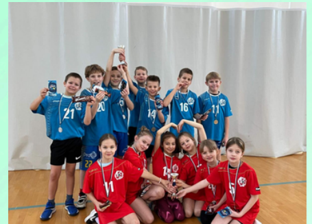
2.-3. klasside pallilahingu võistkonnad.

Küllike Mõisa – pikaajaline ja kohusetundlik töö raamatukoguhoidjana